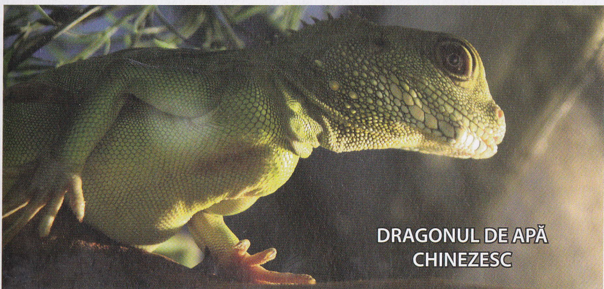
DRAGONUL DE APĂ CHINEZESC

Iguana marină se întâlnește doar pe insulele Galapagos. Este unica șopârlă care trăiește în mare. Poate plonja până la 9 m în adâncime. Atinge 1,7 m în lungime și o greutate de 12 kg. Se mișcă neîndemânic pe pământ. Mănâncă alge, după care iese la soare să se încălzească. Dragonul de apă chinezesc este o șopârlă de circa 1 m în lungime și de culoare verde. Populează China de Sud și Asia de Sud-Est. Trăiește în copaci, dar înoată foarte bine.